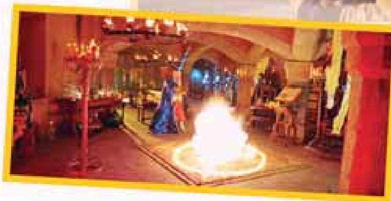
Eine Vorliebe für Musik und dunkle Geschäfte: Hotzenplotz (Armin Rohde) am Zauberschloss