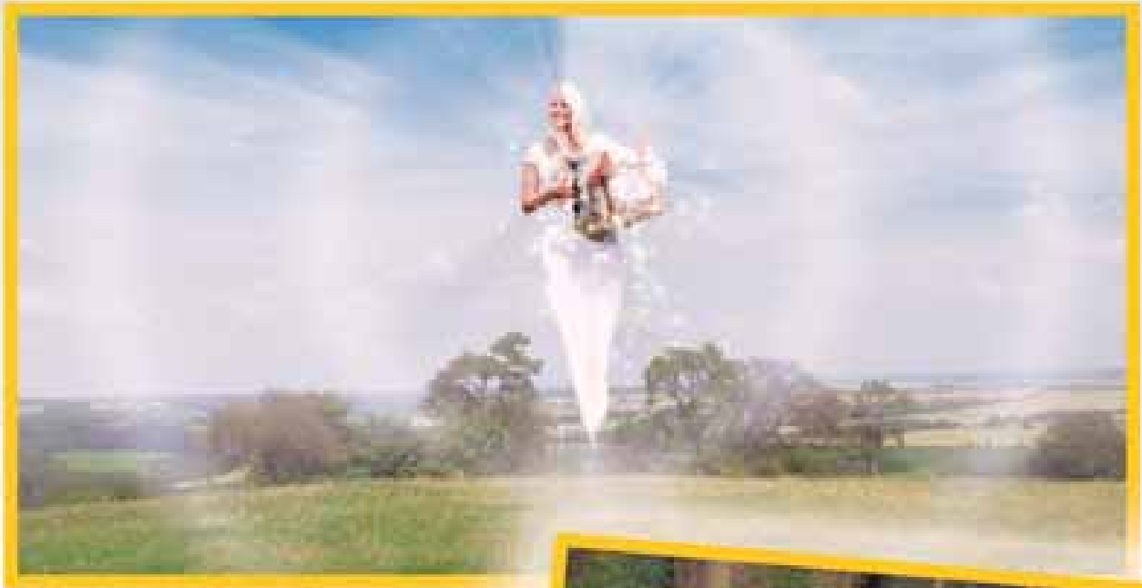
Himmliches Wesen: Die gute Fee Amaryllis (Barbara Schöneberger) sorgt am Ende wieder für Ordnung