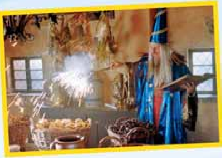
Knollen, die partout nicht wollen: Zauberer Petrosilius Zwackelmann (Rufus Beck) scheitert beim Kartoffelschälen

bekommen sie kleine Veränderungen, ein Schmuckstück, eine andersfarbige Socke, einen Schal ... Sie kommen wieder herein, und die anderen Kinder müssen herausfinden, was sich verändert hat.