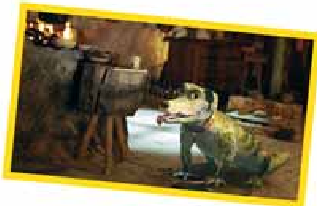
Als Haustier ein Unglück, als Spürnase unersetzlich: der gute Wasti