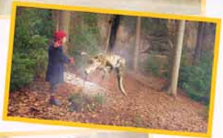
Kasperl (Martin Stührk) setzt einen Feenwunsch für Wastis Rückverwandlung zum Dackel ein