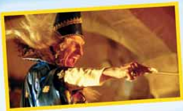
Macht macht böse: Zauberer Petrosilius Zwackelmann (Rufus Beck) mit typischer Handbewegung