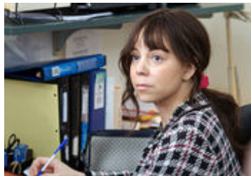
Mariah Carey als Sozialarbeiterin

Precious – Das Leben ist kostbar ist jedoch genau so wenig sentimentale Erlösungsfantasie wie niederdrückendes Sozialdrama. Der große Gewinn des Films liegt gerade darin, dass harter Realismus und gute Unterhaltung keinen Widerspruch bilden. Bunte Traumsequenzen – immer wieder imaginiert sich Precious als umjubelter Star – und ein empathischer Soul-Soundtrack dienen nicht nur als Stimmungsaufheller, sondern erschließen den Charakter der ungewöhnlichen Heldin. Auch begehrt die auf authentische Milieuschilderung bedachte Kamera nicht den Fehler, das soziale Elend durch wackelige Bilder und dunkle Ausleuchtung unnötig zu verstärken. Am stärksten wiegen jedoch die überragenden Schauspielleistungen. Mit feinfühligem Engagement agieren hier Laien wie die Hauptdarstellerin Gabourey Sidibe neben TV-Prominenten und den Popstars Mariah Carey als Sozialarbeiterin sowie Lenny Kravitz als Krankenpfleger John.