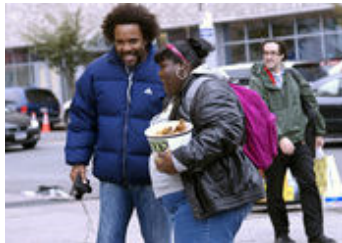
Regisseur Lee Daniels und Hauptdarstellerin bei den Dreharbeiten

Der Begriff "Black Cinema" ist somit gleichermaßen kulturell wie ökonomisch besetzt. Das muss bedacht werden, will man Lee Daniels Film Precious – Das Leben ist kostbar (Precious, USA 2009) historisch einordnen. Auch er ist eine größtenteils "schwarze" Produktion: Regisseur Lee Daniels hat seinen Film co-produziert, die Romanvorlage stammt von der Autorin Sapphire, protegiert wurde er von TV-Star Oprah Winfrey, und in den Hauptrollen sind unter anderem die Komödiantin Mo'Nique, der Musiker Lenny Kravitz und die Entdeckung Gabourey Sidibe zu sehen. Precious erzählt die Geschichte eines missbrauchten Teenagers im Harlem der 1980er-