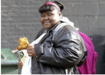
Precious - Das Leben ist kostbar