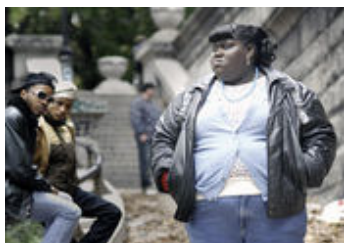
Gabourey Sidibe als Claireece "Precious" Jones

Im New Yorker Stadtteil Harlem des Jahres 1987 ist Selbstbewusstsein dünn gesät. Doch kaum jemanden hat das Schicksal so hart getroffen wie Claireece Jones, genannt "Precious". Nichts an ihrem Leben erscheint "wertvoll". Das schwarze, schwer übergewichtige Mädchen ist mit seinen 16 Jahren schon durch jede Hölle gegangen. In der Schule gehänselt, von der Mutter misshandelt und vom Vater seit der Kindheit regelmäßig vergewaltigt, erwartet sie von diesem ihr zweites Kind. Die erste gemeinsame Tochter hat das Down Syndrom. Den Blick meist zu Boden gerichtet, möchte Precious sich am liebsten unsichtbar machen. Ihr Gang ist so schleppend wie ihr Sprechen. Sich auszudrücken fällt ihr schwer. Sie ist Analphabetin, hat im Leben wenig gelernt außer dem Gefühl der eigenen Wertlosigkeit. Tatsächlich klingt ihr Kosename wie Hohn.