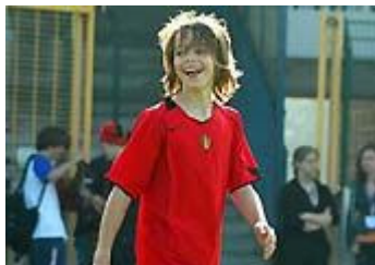
Abseits für Gilles