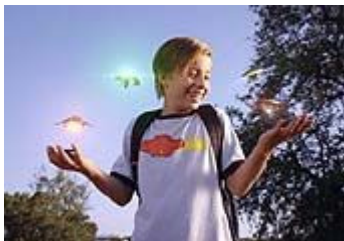
Das Geheimnis des Regenbogensteins

In Mythen und manchen Religionen haben sich die Spuren magischen Denkens aus den frühen Kulturen erhalten. Magisches (animistisches) Denken betrachtet die