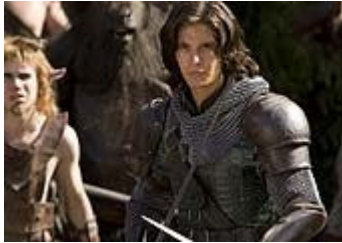
Die Chroniken von Narnia - Prinz Kaspian von Narnia

Die Kulturproduktion von der Märchenerzählung am Feuer über das Kino bis zur Weltschöpfung aus der Computeranimation hat stets Fantasieentwürfe hervorgebracht, die Kindern zu "realen" Spielgefährten wurden. Pippi Langstrumpf gehört dazu und Pan