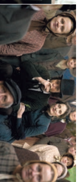
Szene: 10:36:09 – 10:37:00