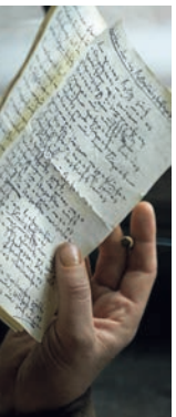
Szene: 10:01:35 – 10:05:55

Beachte dabei äußere Einflüsse, Handlungsmotive, die Entwicklung seiner Schriften und seiner Sprache und die Entwicklung seiner politischen Position in Auseinandersetzung mit anderen Intellektuellen seiner Zeit (z.B. Vertreter des Anarchismus, Frühsozialismus und den Junghegelianern) bis hin zur Herausgabe des Kommunistischen Manifests!