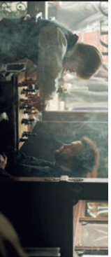
Szene: 10:18:57 – 10:24:03