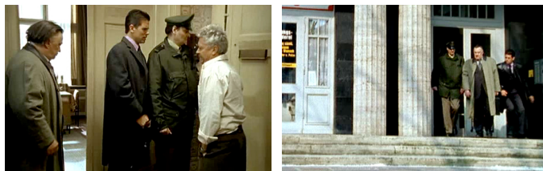
ALLES AUF ZUCKER!